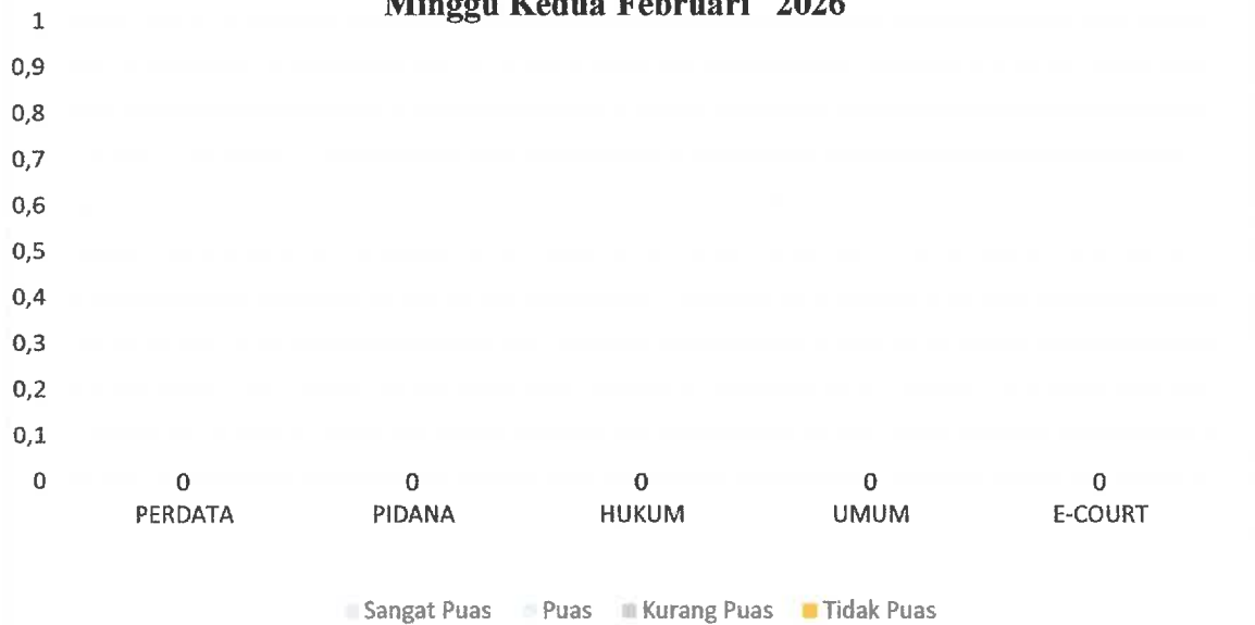
Matrik Responden untuk Periode Minggu Kedua Bulan Februari Tahun 2026